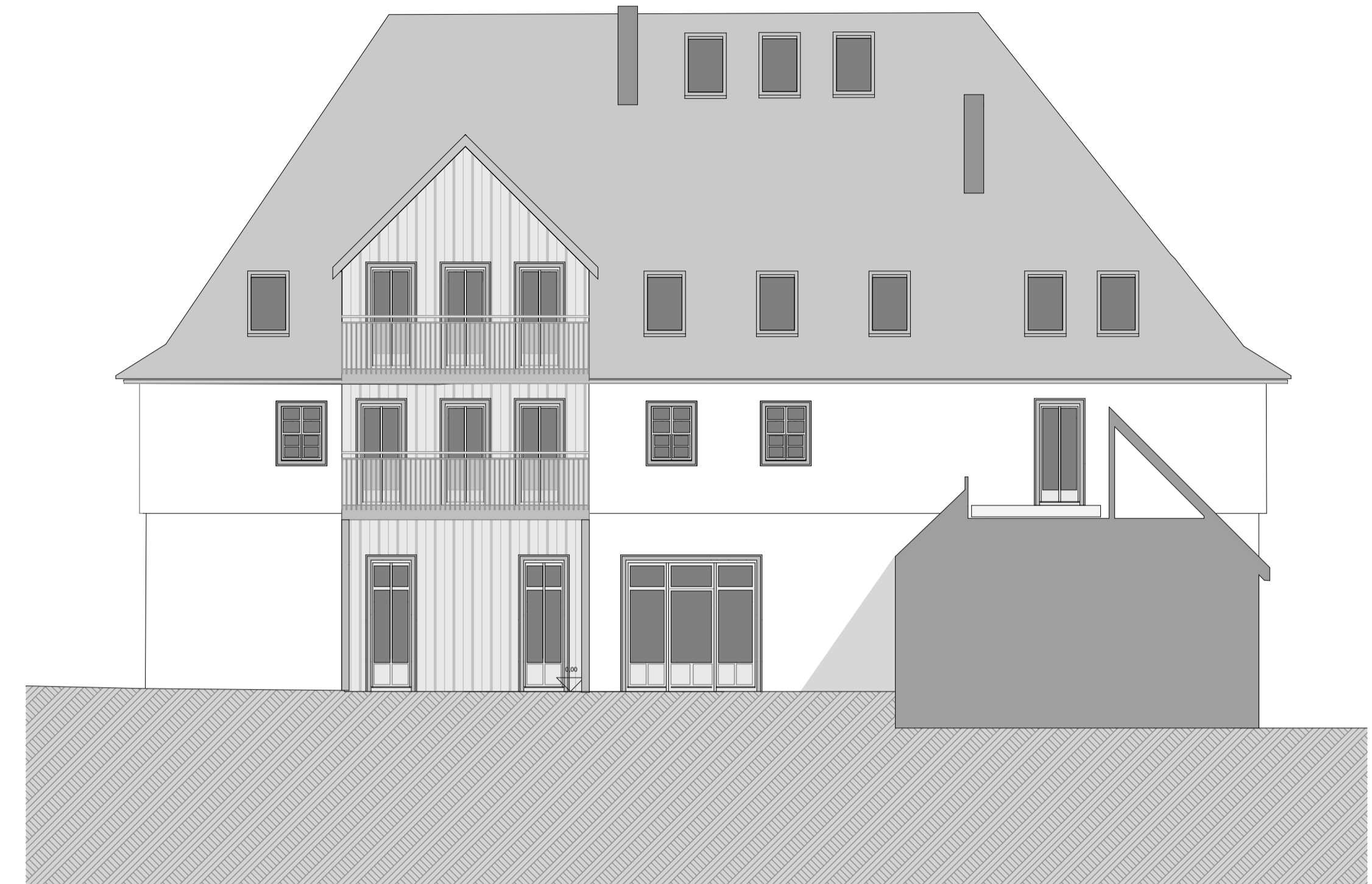
Vorzugsvariante mit Planung 1:100