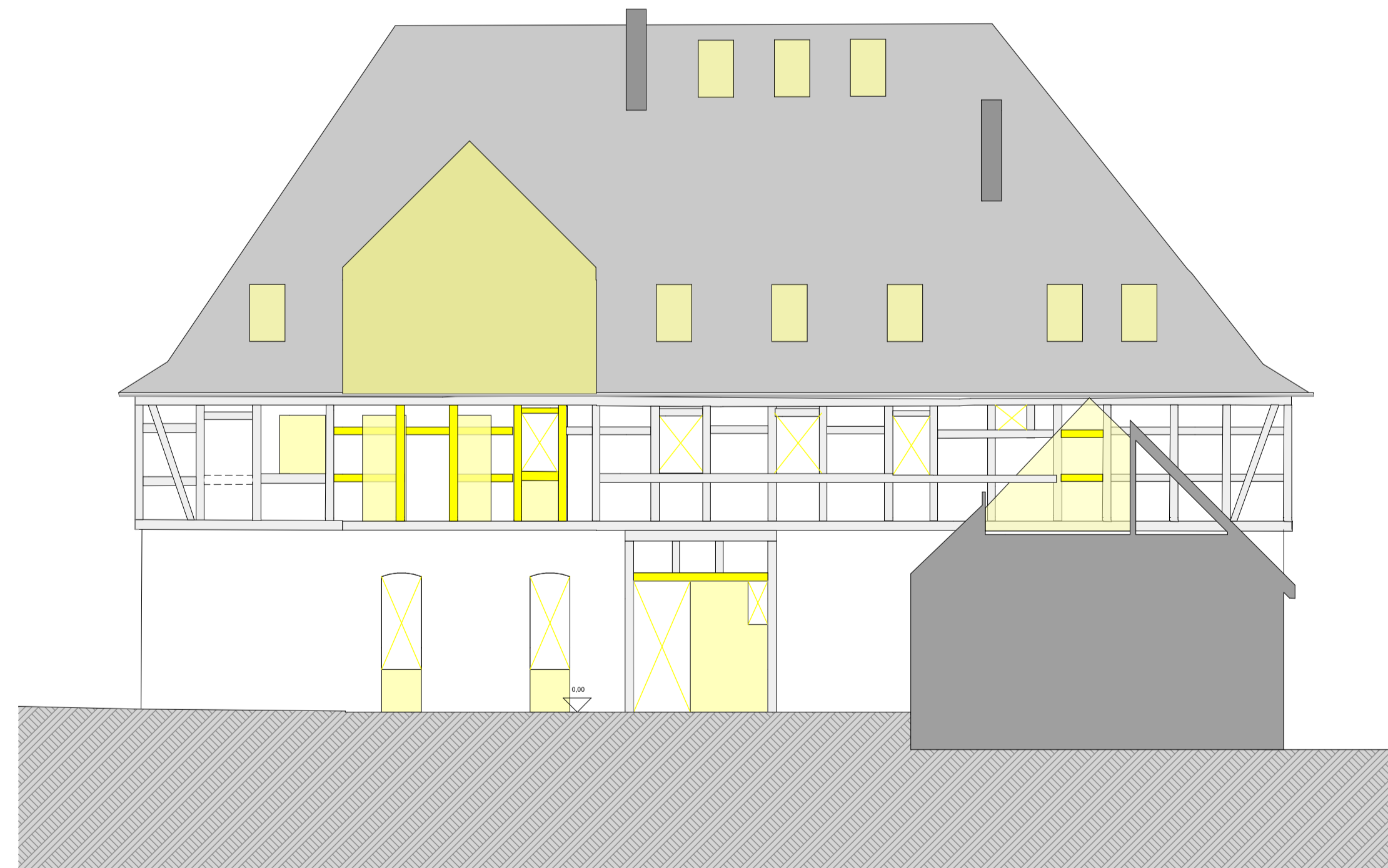
HG Hoffassade mit Abriss (gelb) 1:100