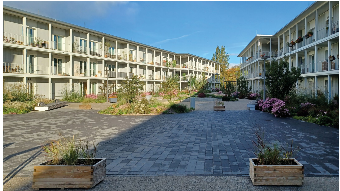
Johanniterzentrum „AndreasGärten“ Erfurt